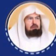
معالي الشيخ الدكتور عبدالرحمن بن عبدالعزيز السديس