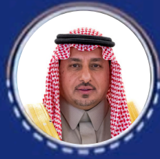
سعادة الوكيل الاستاذ خالد بن محمد الباهلي