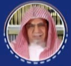
معالي الشيخ الدكتور صالح بن عبدالله الحميد