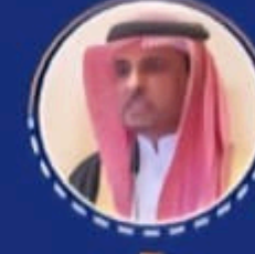
سعادة الاستاذ الدكتور خليفة بن عبدالرحمن المسعود