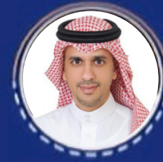
معالي المهندس هيثم بن عبدالرحمن العوهلي