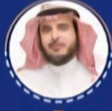
سعادة الاستاذ أحمد بن عبدالله الشبل أمين عام الجائزة