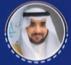
سعادة الاستاذ الدكتور محمد بن فهد الشارخ