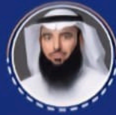
معالي المهندس اسامة بن محمد الزامل