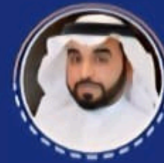
معالي الدكتور أحمد بن فهد الفهيد